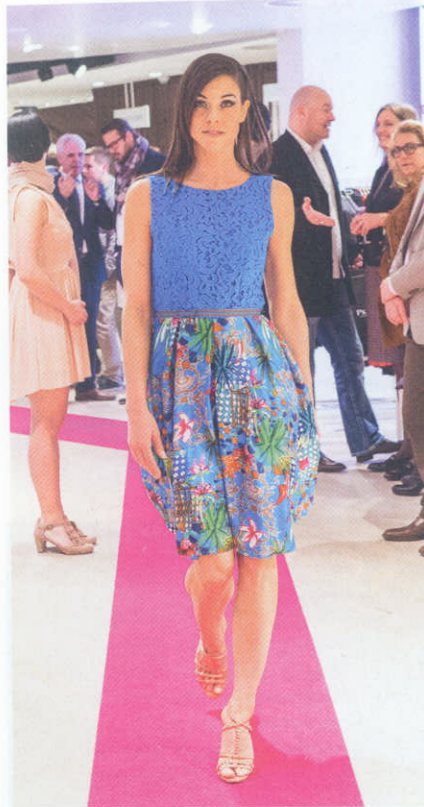
Schauspielerin Kiki Maeder auf dem Catwalk.