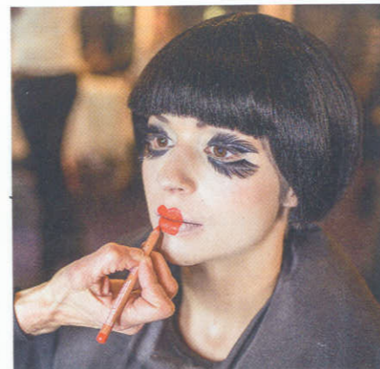
Letzter Make-up-Schliff im Backstagebereich.